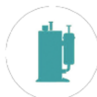
Compressore rotativo full inverter