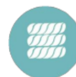
Scambiatore di calore spirale in titanio